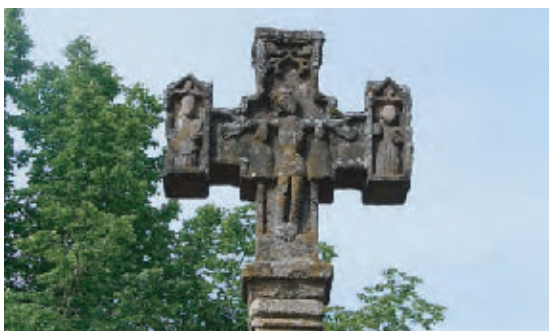
Croix de Cheissoux

12 Avant d'arriver à la route D 13, prendre le chemin à gauche qui remonte jusqu'à "La Texonnière".